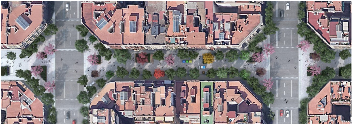
Tram de l'eix verd de Girona, amb més presència del verd i arbrat.

El subsòl serà ric i permeable, i es passarà d'un model que actualment no infiltra l'aigua de pluja al terreny a un model que preveu infiltrar-ne el 30%. L'aigua es recollirà en les àrees vegetades, cosa que afavorirà la seva infiltració i retenció. Actuaran com a dispositius SUDS (sistema urbà de drenatge sostenible), i s'ubicaran majoritàriament a les cruïlles i places, on hi ha més espai.