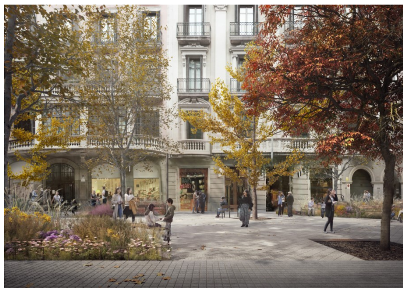
Tram de l'eix de Consell de Cent on s'observa l'ús del panot i el granit a les zones d'estada.

S'elimina l'asfalt i l'actual divisió d'alçades entre la vorera i la calçada, de manera que es crea una plataforma única que afavoreix l'ús social del carrer. Per als paviments s'utilitzarà el panot i el granit, materials ja utilitzats en zones de passos de vianants de l'Eixample. El panot es col·locarà a prop de les façanes i en els creuaments, i el granit, a la resta de l'espai més central, coincidint amb les zones d'estada i a les placetes.