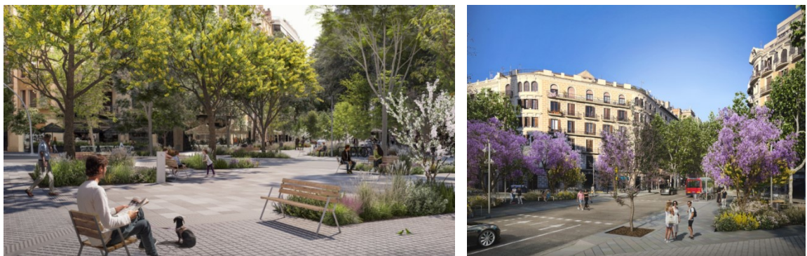
Placetes de Rocafort amb Aragó (esquerra) i Consell de Cent amb Casanovas (dreta).

Com a punt rellevant, als eixos verds apareixen tot un seguit de semiplaces o placetes que suposen nous llocs d'estada i espais de joc infantil per afavorir l'ús social del carrer i generar un recorregut continu, amable i tranquil. En concret, al llarg dels encreuaments dels quatre primers eixos amb cada carrer es crearan 31 placetes noves de 1.450 m 2 , cadascuna dividida en dos àmbits de 725 m 2 a cada costat de l'encreuament. I se sumaran a les quatre places amb projecte propi.